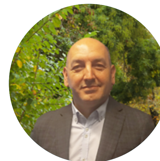
Mitchel Farladansky Soporte autorizaciones IMPPA A.G.